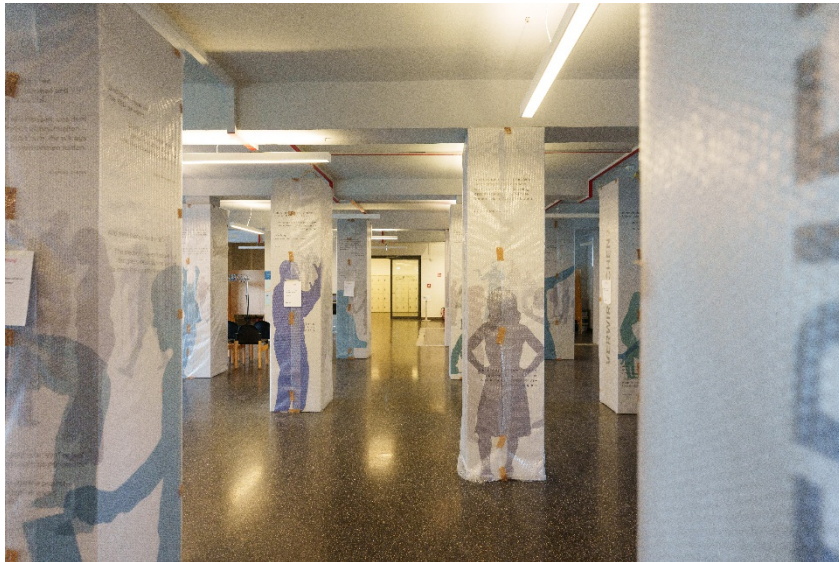
Noch sind die Säulen im Foyer verpackt, zur Eröffnung werden sie ausgepackt und laden die Besucher zur Selbstreflexion ein.