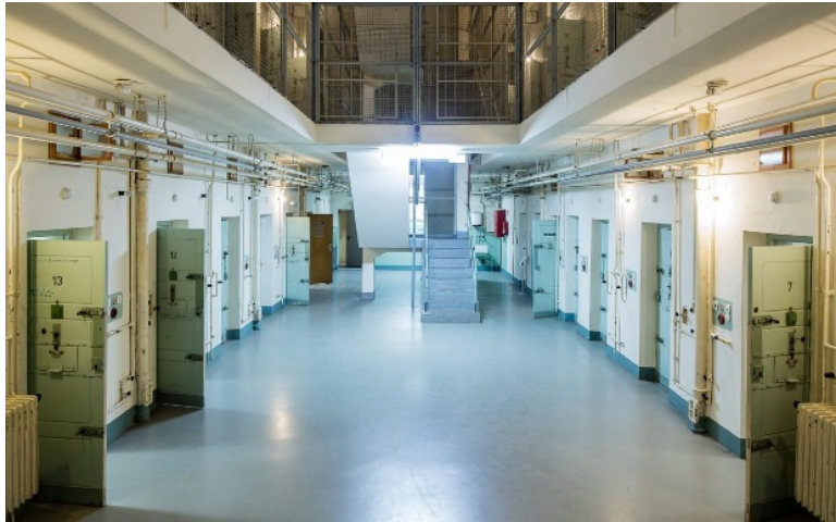
Blick in das Stasi-Untersuchungsgefängnis

Jeden ersten Sonntag im Monat 11:00–12:30 Uhr: nur Eintritt