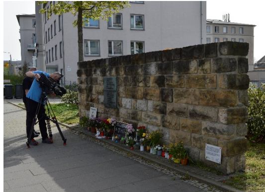
Der Gedenkort für Alexej Nawalny an der Gedenkstätte