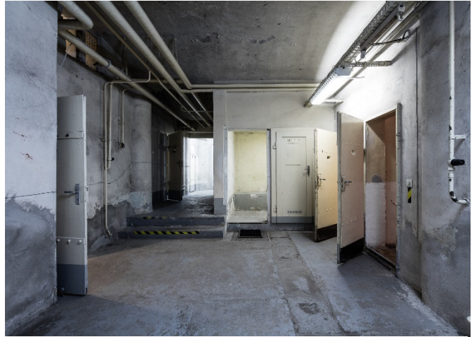
Sowjetischer Haftkeller

Dort, wo später ein umfassender Staatssicherheitskomplex entstehen sollte, befanden sich bis zur Mitte des 19. Jahrhunderts noch Park- und Grünflächen, die im Laufe der Gründerzeit mit prachtvollen Villen und vereinzelt Industrieanlagen bebaut wurden. Die Sowjetische Militärverwaltung in Sachsen besetzte nach dem Zweiten Weltkrieg das Gelände. In beschlagnahmten Wohnhäusern wurden oftmals provisorische Gefängniszellen eingerichtet, wo Verhaftete mitunter wochenlang festgehalten wurden. Die Haftkeller verschwanden mit der zunehmenden Zentralisierung. 1950 entstand in der